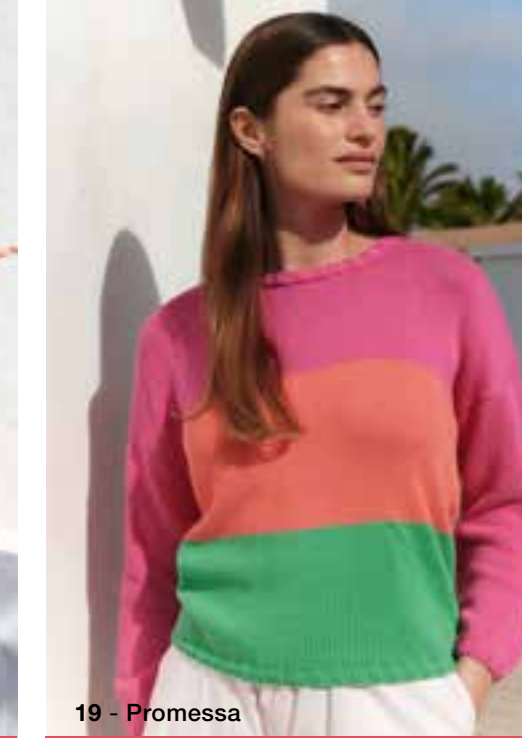
19 - Promessa