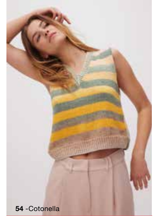
54 - Cotonella