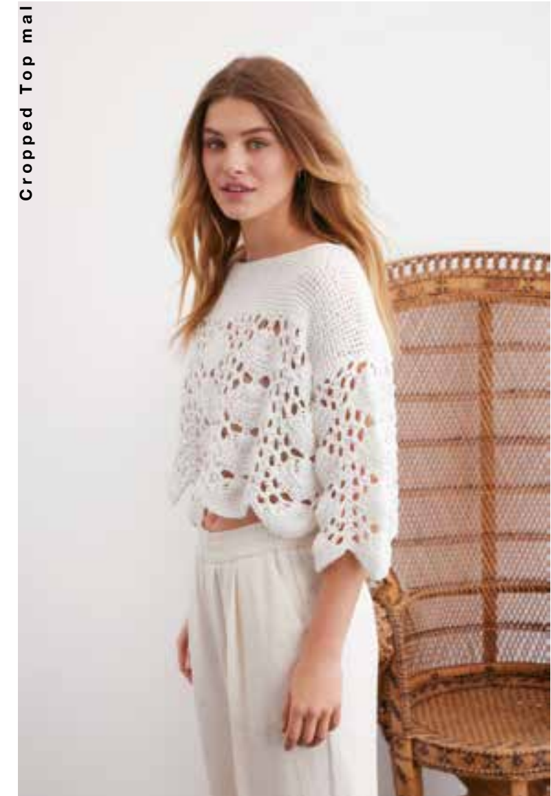
Cropped Top mal anders