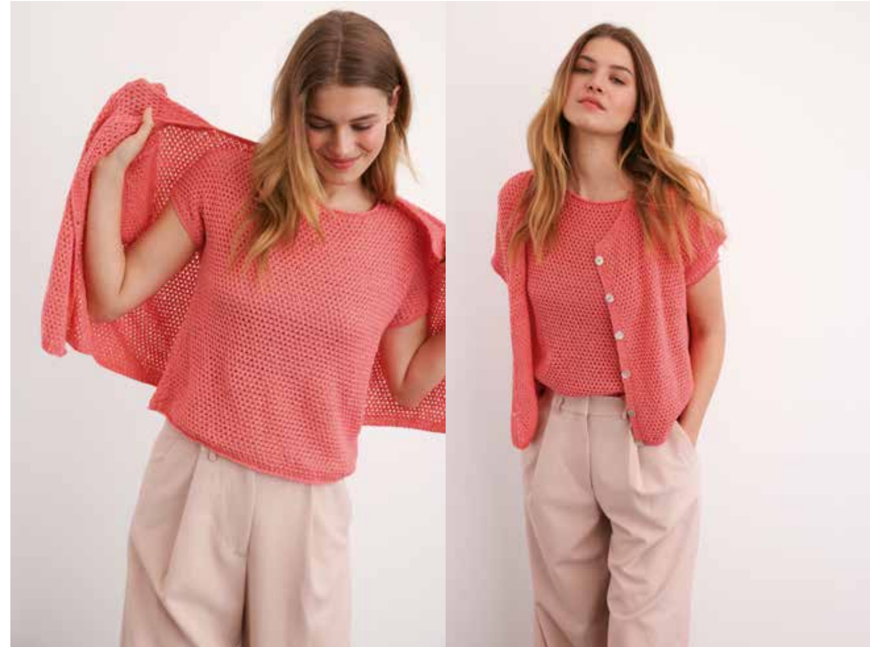
49 & 50 . Twinset - CAMPO Twin-Sets sind chic – und eine praktische Antwort auf unbeständiges Wetter. Unseres wurde im Reismuster gestrickt. Die Form ist einfach und anfängerfreundlich.