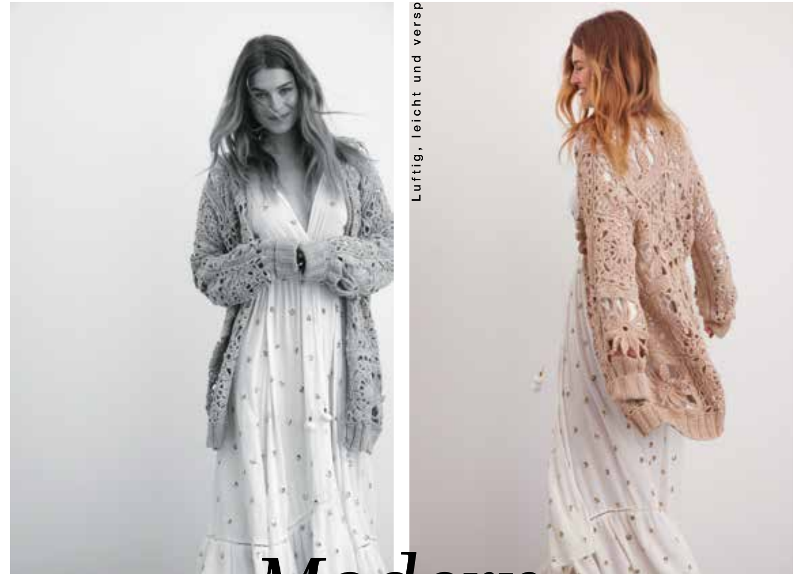
Luftig, leicht und verspielt zugleich